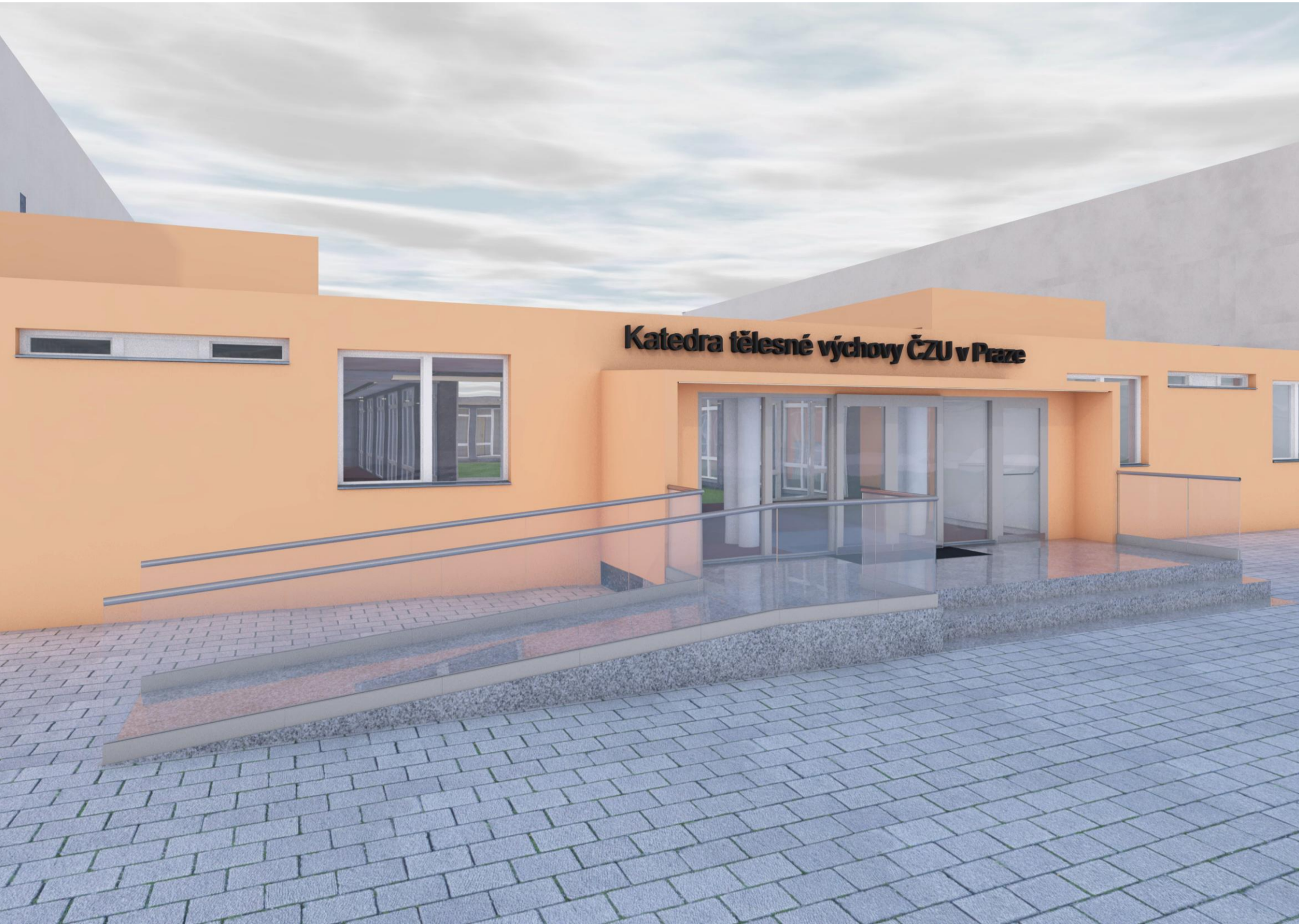
Vnější pohled na bezbariérovou rampu, úpravy exteriérové podesty a vstupních posuvných dveří