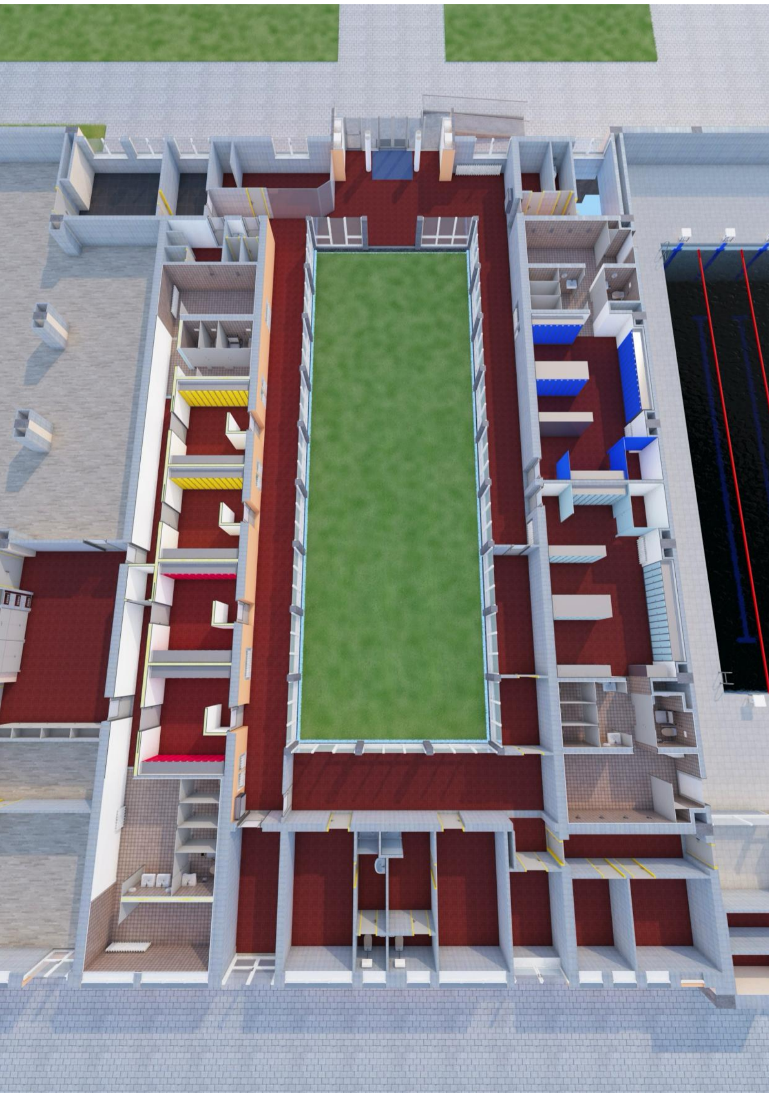
Axonometrický 3D pohled na půdorysný řez - od hlavního vstupu